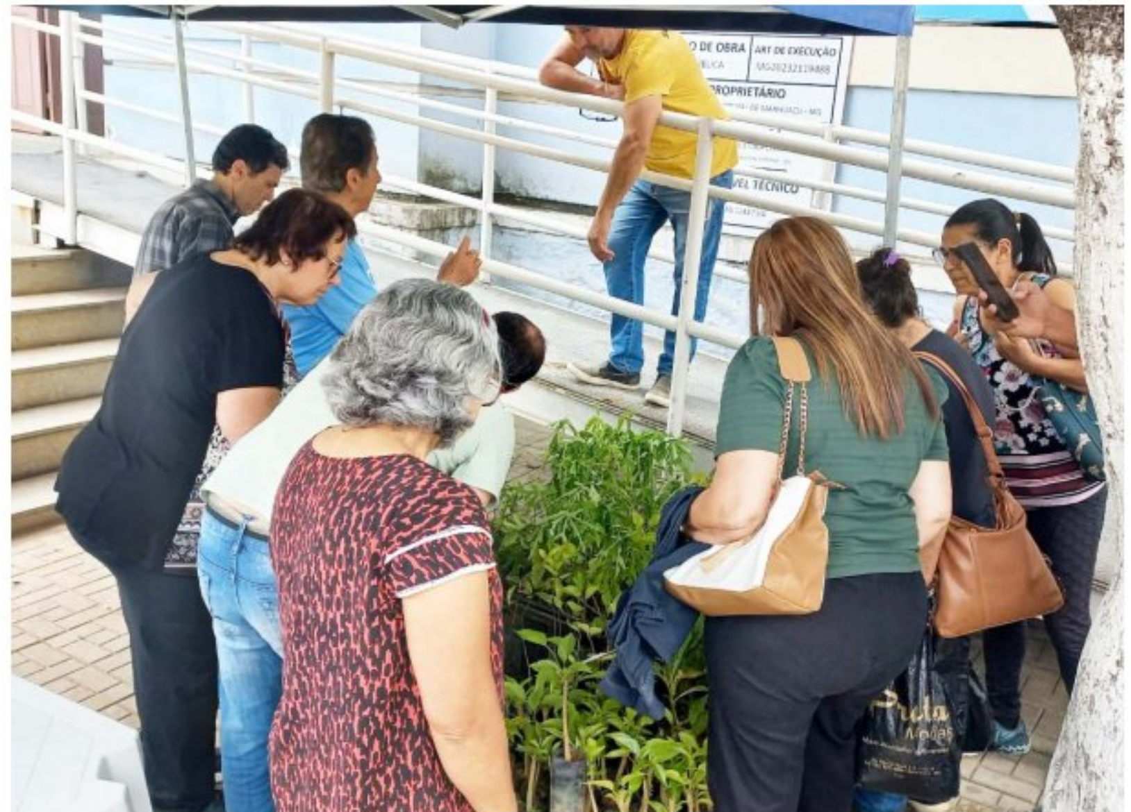
Mudas foram distribuídas para as pessoas que passavam pelo local