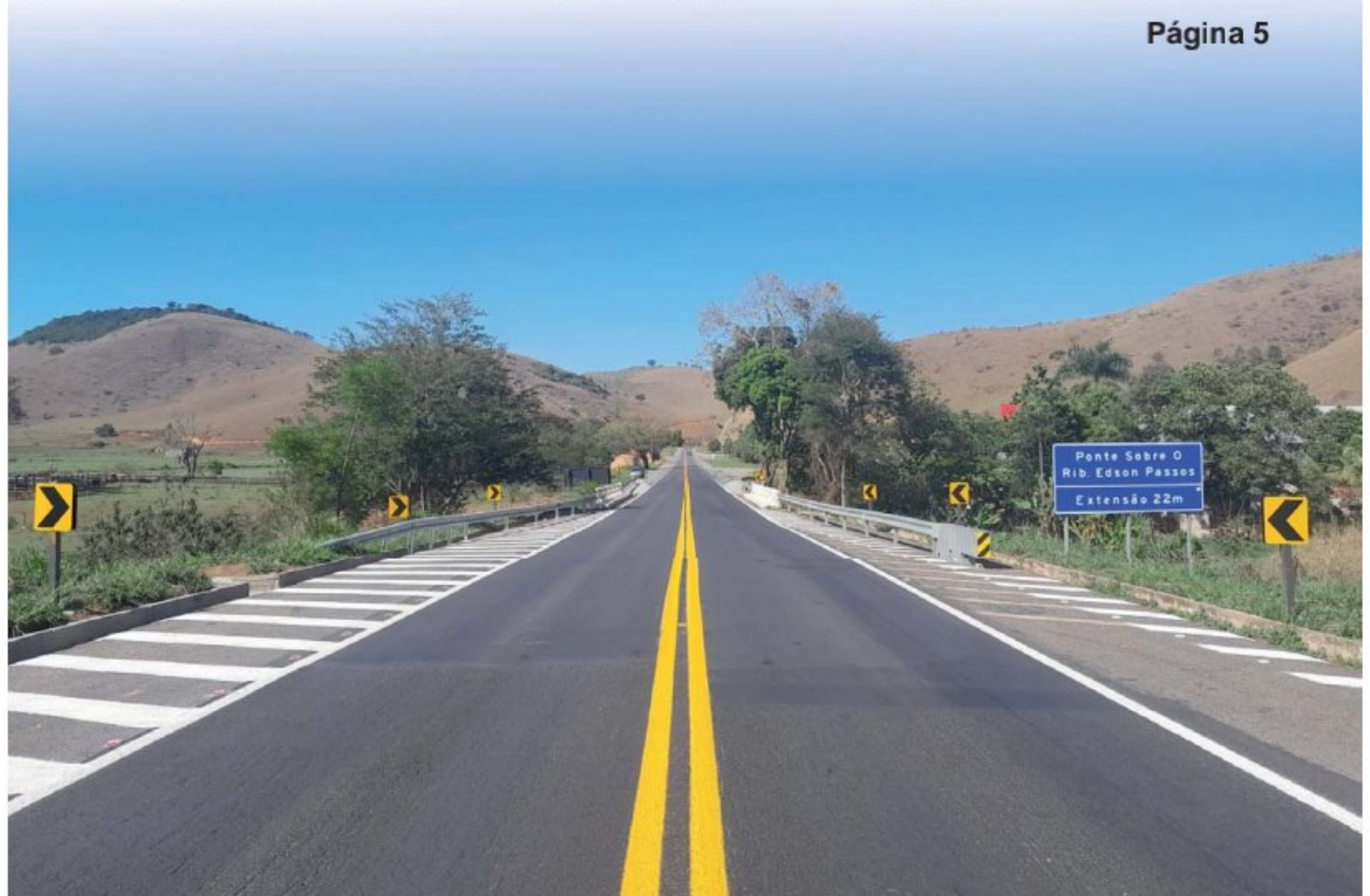
Em todo o trecho sob concessão, mais de 400 estruturas entre pontes, passarelas e viadutos foram revitalizadas