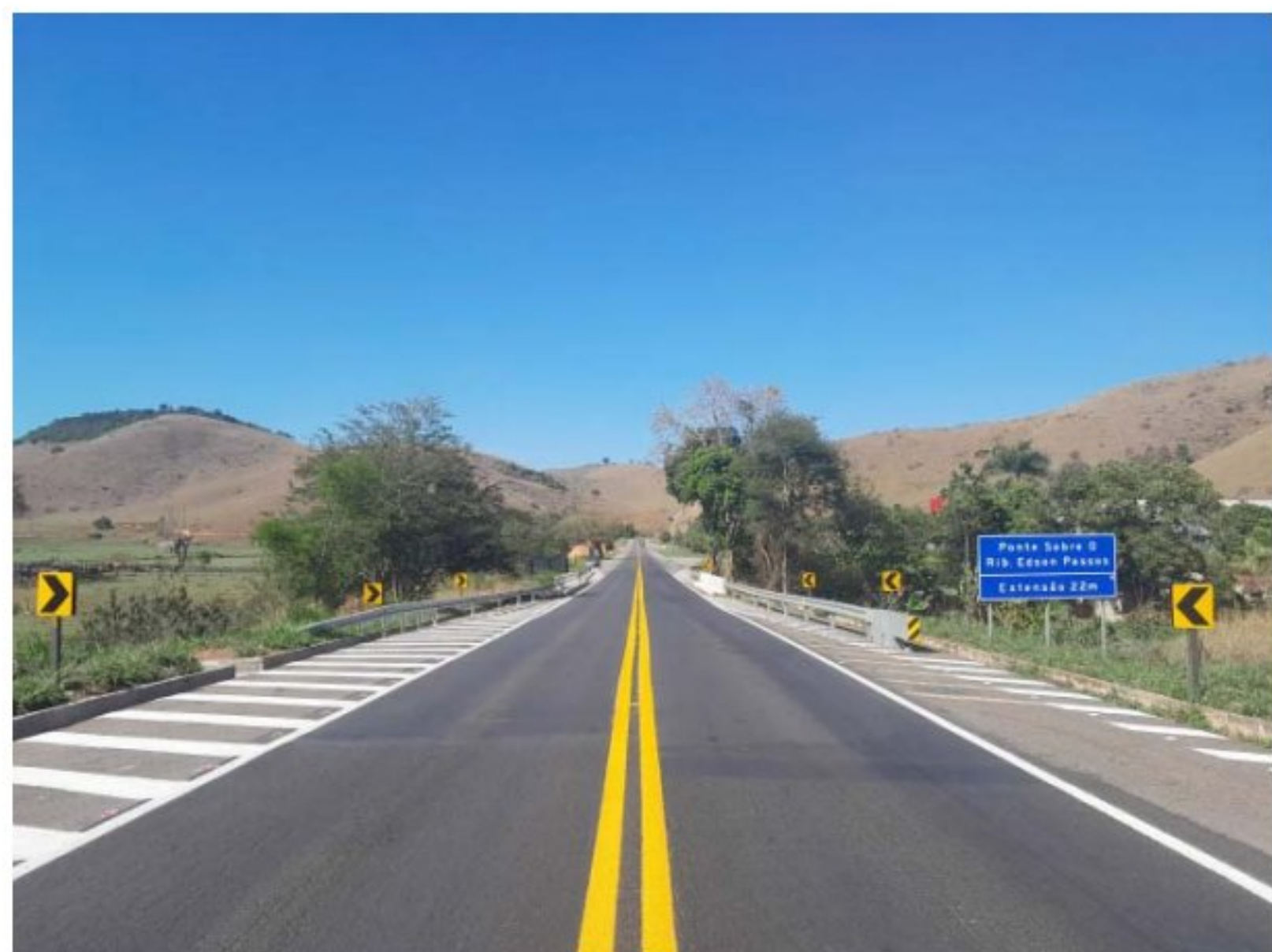
Em todo o trecho sob concessão, mais de 400 estruturas entre pontes, passarelas e viadutos foram revitalizadas

deste, Centro-Oeste, Norte e Nordeste, gerencia dois ativos logísticos: um pátio regulador e um terminal portuário que atendem ao Porto de Santos, o maior da América Latina. Ao longo de mais de 20 anos, a EcoRodovias está presente em corredores rodoviários de escoamento da produção agrícola e industrial, bem como em relevantes eixos turísticos do país, proporcionando viagens com mais fluidez, segurança e conforto.