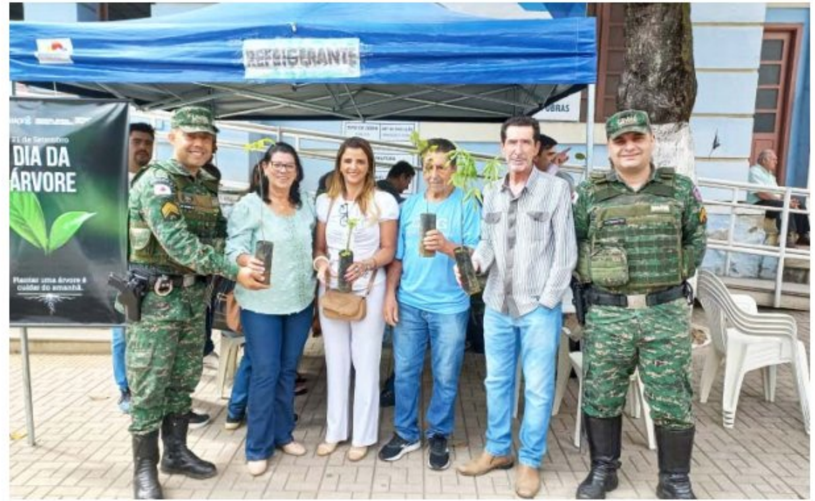
Ação foi promovida pela Prefeitura em parceria com a Câmara Municipal de Manhuaçu, Conselho Municipal de Meio Ambiente, PM Ambiental, ONG Pró-Rio Manhuaçu e do IEF