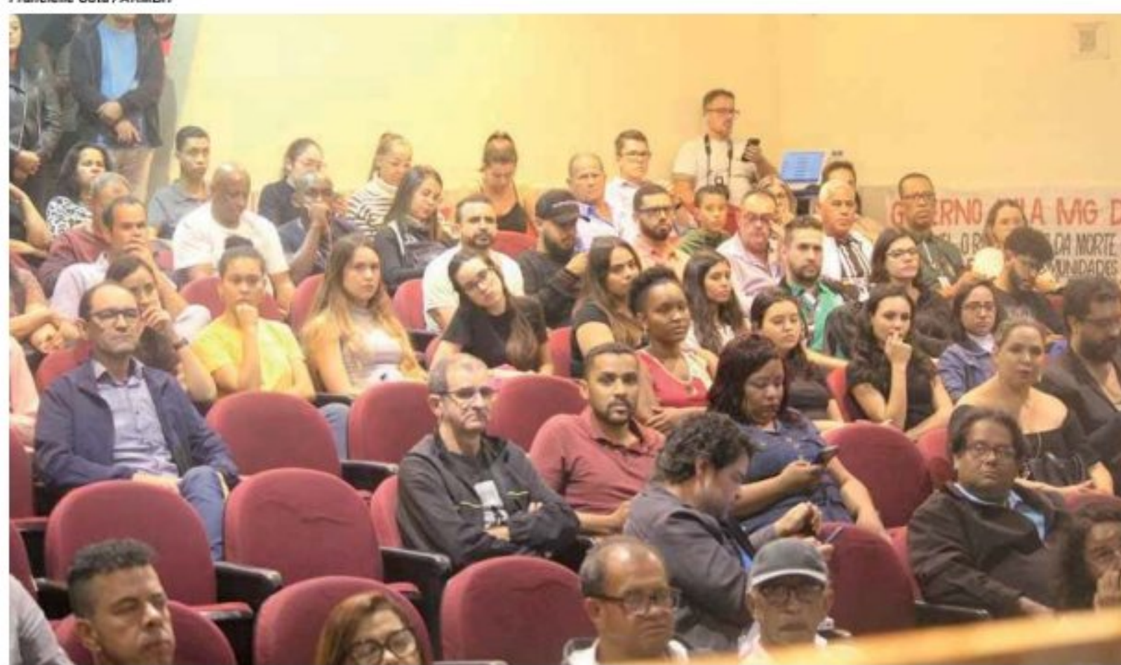
Francielle Cota / ARMBH

O Plano Diretor de Desenvolvimento Integrado da RMBH é financiado com recursos do Acordo de Reparação ao rompimento da Vale, em Brumadinho, que tirou a vida de 272 pessoas e provocou uma série de danos ambientais, econômicos e sociais. (Ag. Minas)