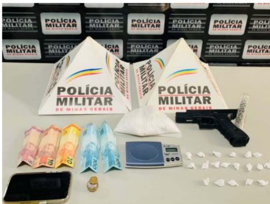
Material apreendido durante o cumprimento dos mandados em Matipó