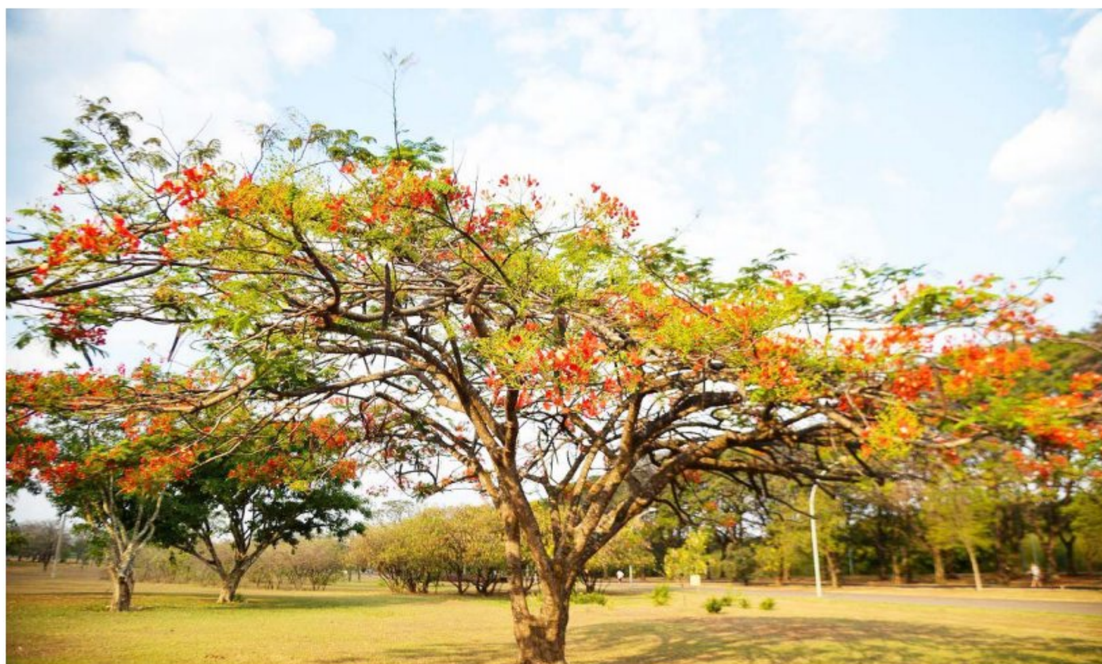
Começou na madrugada deste sábado (23), mais precisamente às 3h50 da madrugada, a primavera no hemisfério sul

“O nosso Calendário Gregoriano baseia-se no ano trópico e institui um ano bissexto em todos os anos divisíveis por quatro, exceto para séculos inteiros, que só são bissextos se forem múltiplos de 400. Isso faz com que o instante do início de uma estação seja próximo ao instante do início da mesma estação quatro anos antes ou quatro anos depois”, finalizou o Observatório. Ag. Brasil