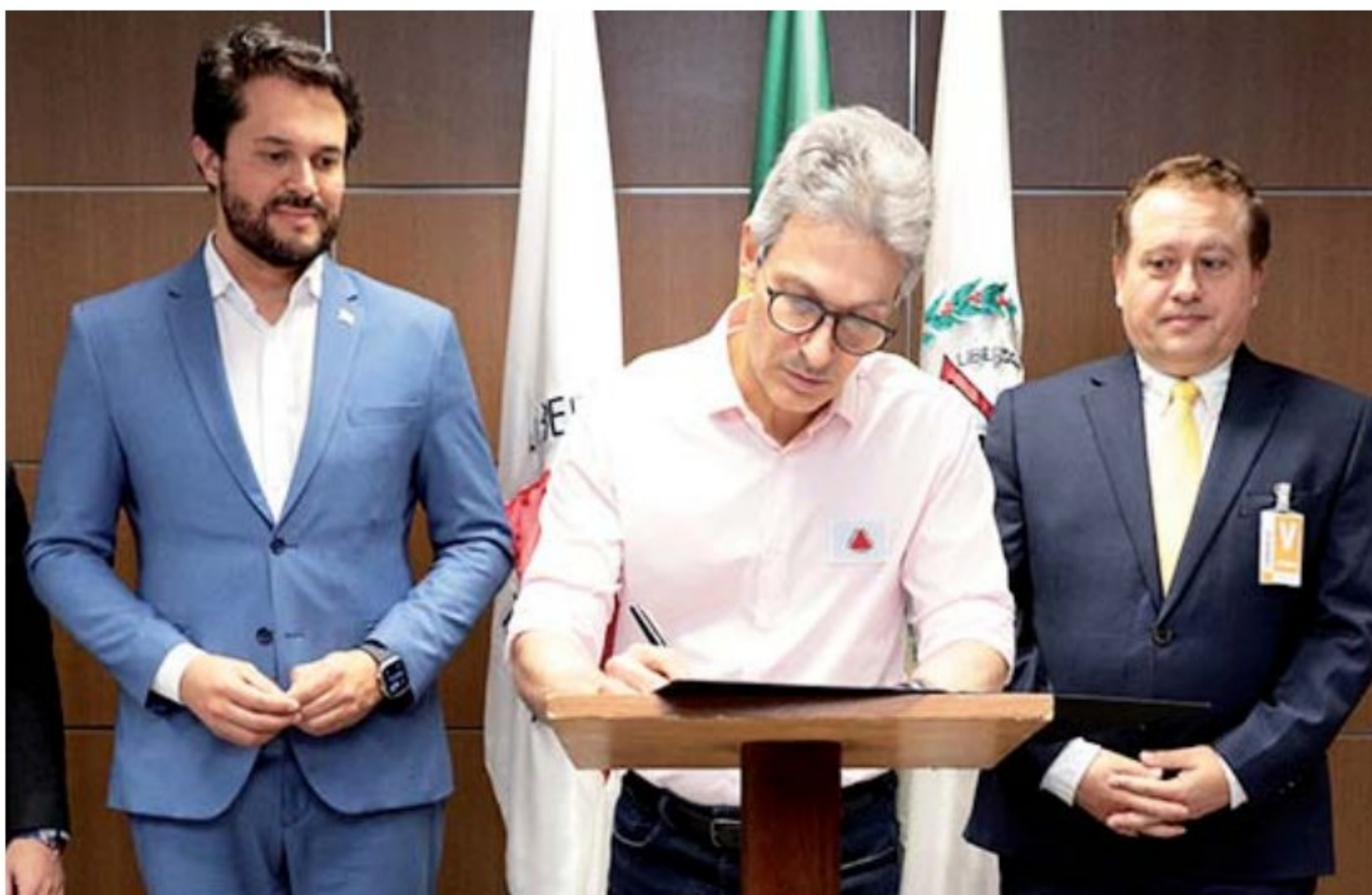
Gil Leonardi / Imprensa MG