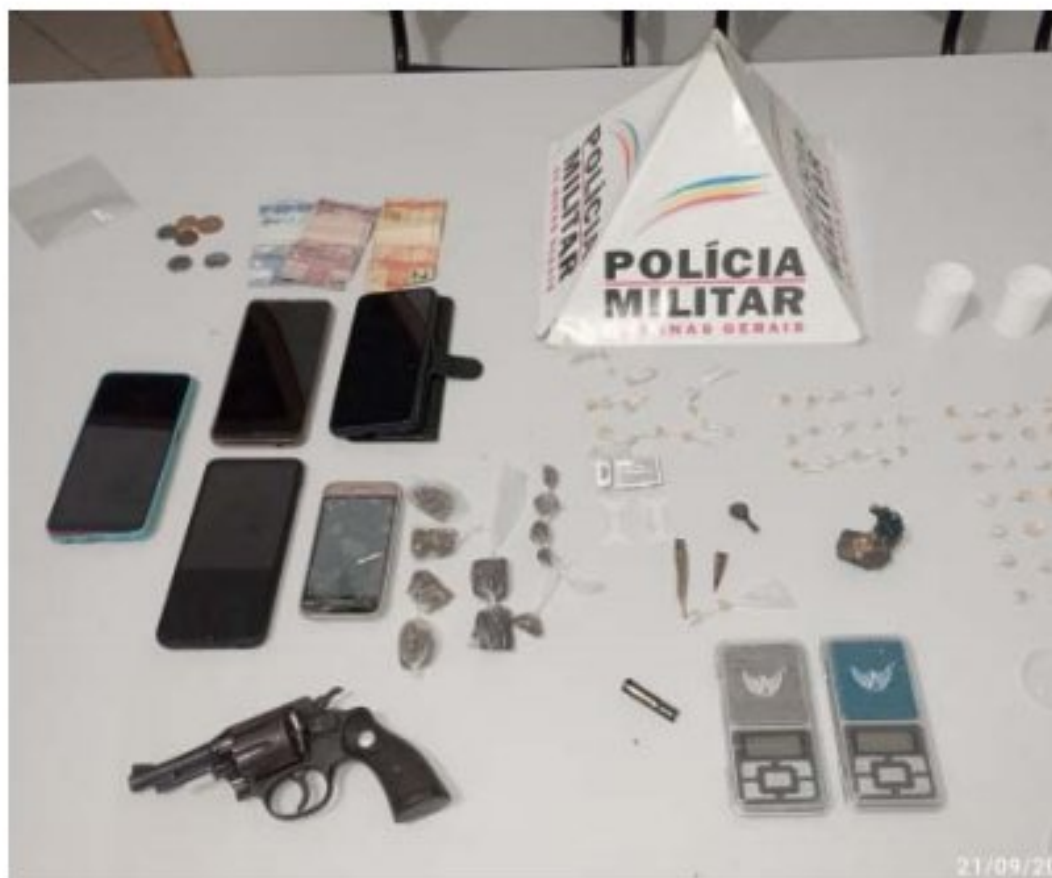
Material apreendido em Espera Feliz