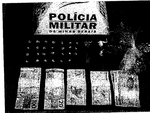
Dinheiro e droga recolhidos pelos policiais

No local, ao realizar incursão, os militares visualizaram dois indivíduos que se encontravam sentados, que ao perceberem a presença dos militares fugiram, não sendo localizados. No local onde eles se encontravam, foi localizada a arma e as munições, que foi apreendida e encaminhada à delegacia de Polícia Civil.